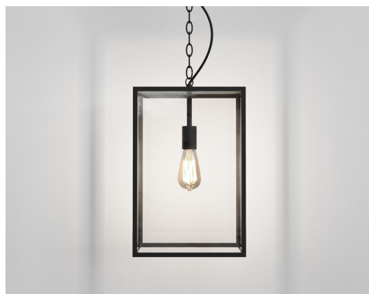
CODE: 1095033 FINISH: TEXTURED BLACK

This product is not suitable for installation within five miles of the coast. For these environments, please filter products on the astro website by 'coastal'.